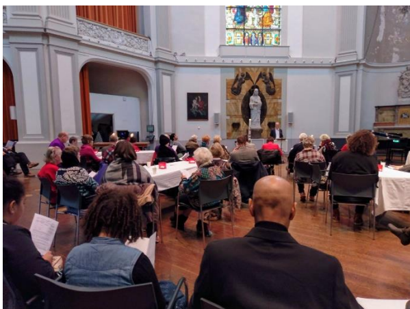
Eindejaarsviering in de Duif