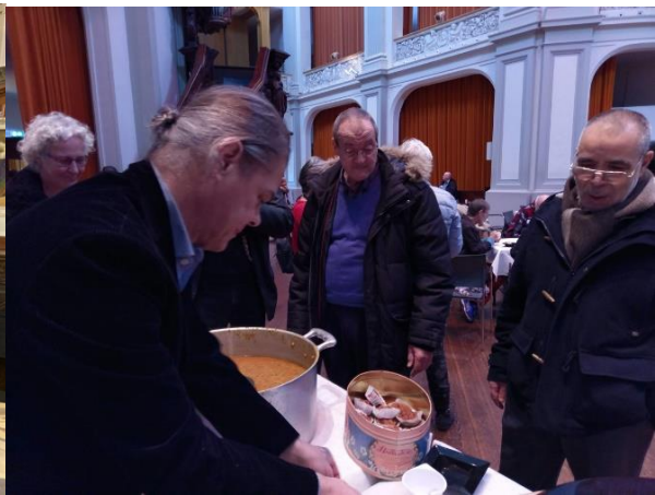
Eindejaarsviering 2019 De Duif