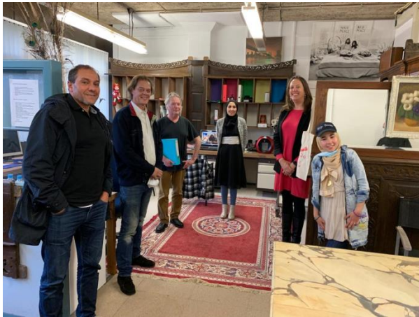
Bezoek wethouder onderwijs, armoede en inburgering Gemeente Amsterdam, oktober 2020